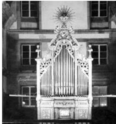
Órgão da paróquia de S. José (vista geral)